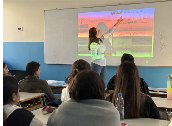
موظفون مخلصون، وتلامذة ملهمون: معاً نحقق التميز في التعليم

مع بداية عام 2025، ستعود المدارس الرسمية إلى البرنامج الدراسي الأسبوعي البالغ 28 ساعة، مع إيقاف العمل بالبرنامج الحالي الذي يتضمن 21 ساعة أسبوعياً.